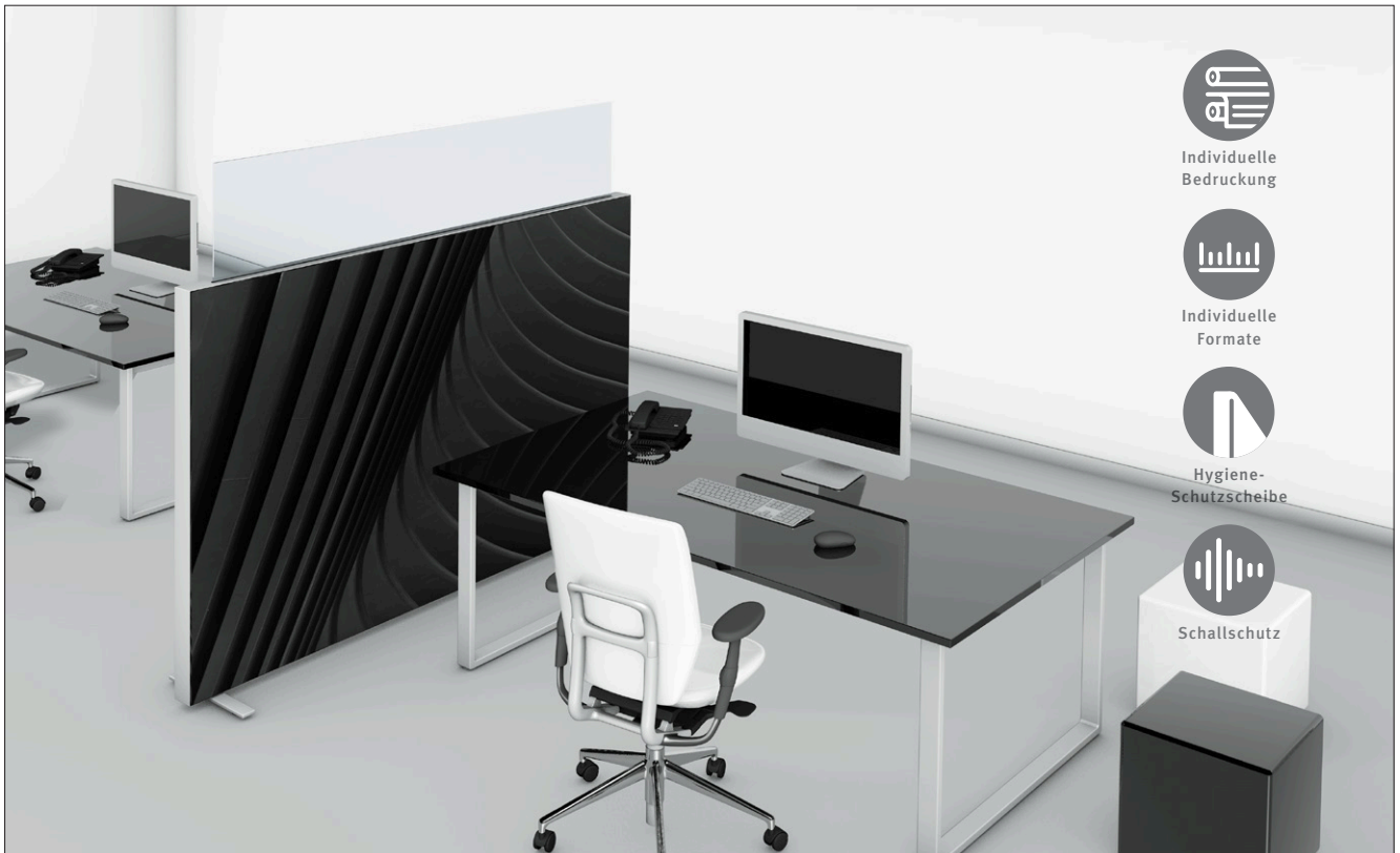
Beispiel Akustik-Separationswand mit Akustikeinlage und textiler Bespannung | Hygiene-Schutzscheibe 5 mm (H = 300 mm) | 2100 mm x 1400 mm x 80 mm