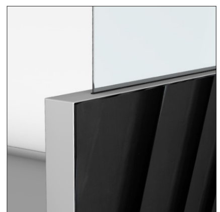
Alurahmen mit Trendfarbe Silber. In Alurahmen eingelassene Hygiene-Schutzscheibe 5 mm (H = 300 mm)